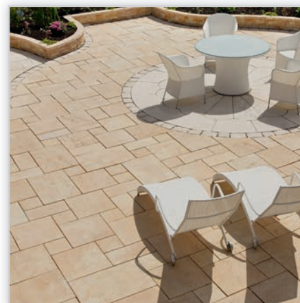
Trawertyn. Kolory: kamienna szarość, słoneczny brzeg, krem prowansalski. Wymiary płyt [cm]: 21,7/21,7; 44,2/21,7; 44,2/44,2; 66,7/44,2.