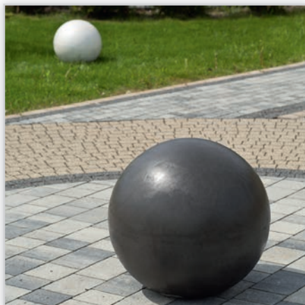
Kule. Kolory: perła biała, perła grafitowa. Wymiary kul [cm]: Ø 20, Ø 35, Ø 50.