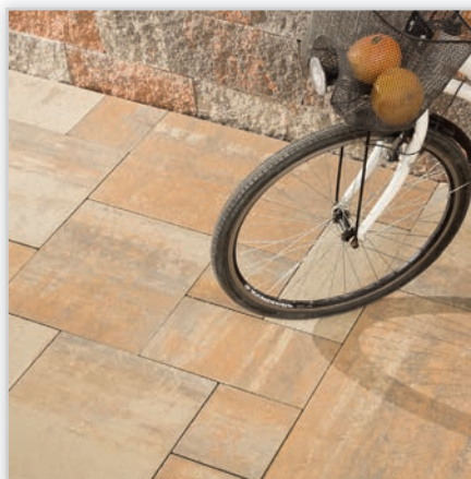
Romaliit. Kolory: perła złoto-beżowa, perła kremowa jasna, perła grafitowo-srebrna, perła miedziana, wapień dewoński, wapień krem jurajski, pastelowa harmonia, wapień muszlowy, cappuccino, wapień dewoński terazzo rustical, wapień krem jurajski terazzo rustical, pastelowa harmonia terazzo rustical, cappuccino terazzo rustical, granit jasny, wapień muszlowy terazzo rustical, granit szary terazzo rustical, bazalt terazzo rustical, granit kremowy terazzo rustical. Wymiary płyt [cm]: 67,5/45; 45/45; 45/22,5; 22,5/22,5.