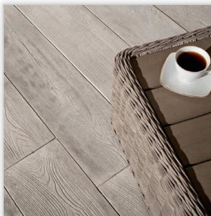
Deska ogrodowa. Kolory: świeże drewno, stalowy, brzoza, brąz patyna. Wymiary desek [cm]: 22,5/120, 22,5/90, 22,5/67,5, 30/90, 30/120, 22,5/22,5, 45/120, 15/45, 15/60, 45/90 (deska dzielona na 2 i na 3), 45/120 (deska dzielona na 2 i na 3).