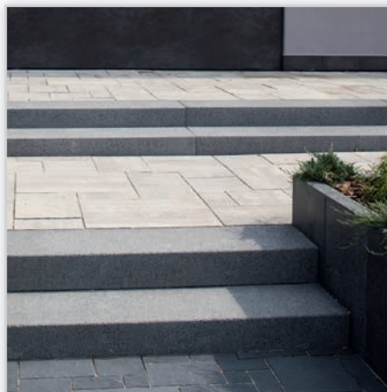
Stopnie blokowe. Kolory: granit czarny terazzo/terazzo rustical, granit szary terazzo/terazzo rustical, granit kremowy terazzo/terazzo rustical, granit jasny terazzo/terazzo rustical, marmur mango terazzo/terazzo rustical, granit miedziany terazzo/terazzo rustical, granit szaro-bursztynowy terazzo/terazzo rustical, marmur biały terazzo/terazzo rustical. Wymiary stopni [cm]: 80/35/15, 100/35/15, 120/35/15, 160/35/15, 200/35/15, 160/40/18, 200/40/18.