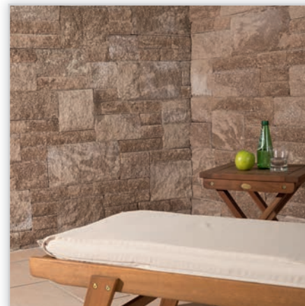
Gardenit. Kolory: brekcja krabon, brekcja spizowa, brekcja żółta, tytan kremowy, brekcja cappuccino, piaskowiec żółty. Wymiary bloczków [cm]: 15/7,5, 22,5/15, 22,5/22,5, 22,5/7,5, 30/15, 30/22,5, 30/7,5, 45/15, 45/22,5.