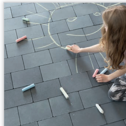
Urbanit. Kolory: wapień muszlowy, wapień dewoński, perła grafitowa, granit jasny, granit szary, bazalt, granit kremowy, szary, grafit. Wymiary kostek [cm]: 16/16, 24/16.